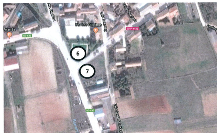
Castilruiz. Cruce de SO-630 con SO-P-1120 a San Felices / Aguilar del Rio Alhama