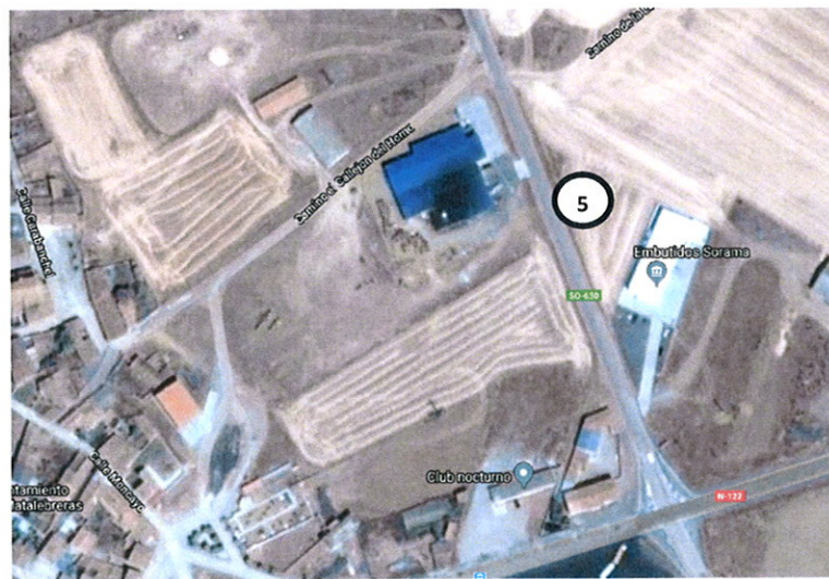
Matalabreras. Cruce de N-122 con SO-630