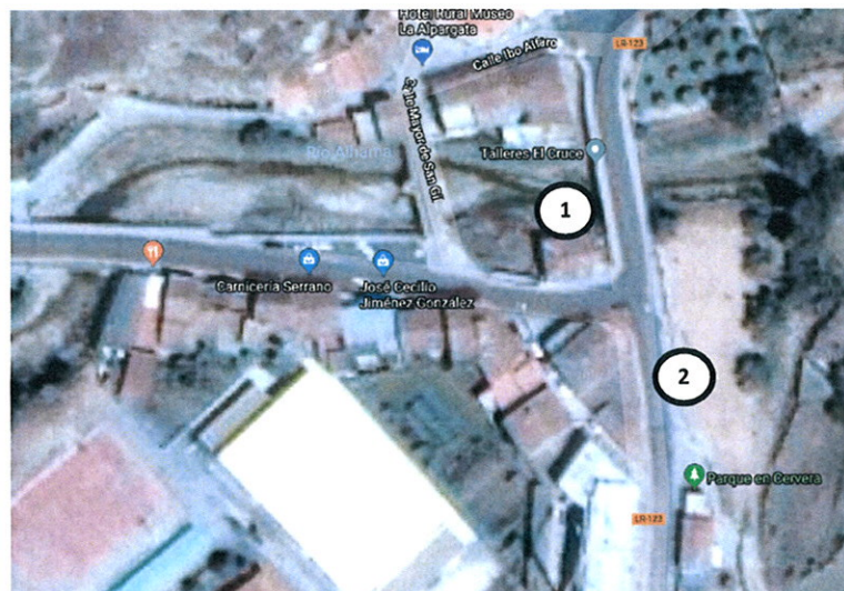
Aguilar del Río Alhama. Cruce de LR-123 con LR-284